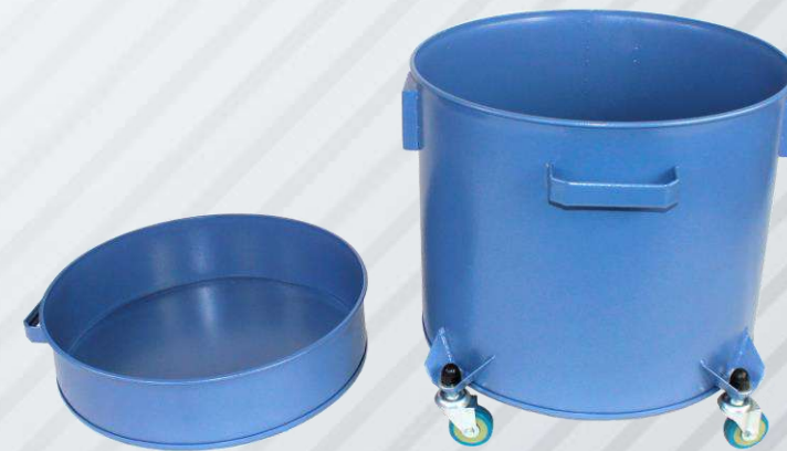
2 БАКА: 40+12 Л